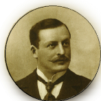
Giuseppe Motta Airolo, 29.12.1871 Berna, 23.01.1940

a tutti coloro che hanno sostenuto questa manifestazione